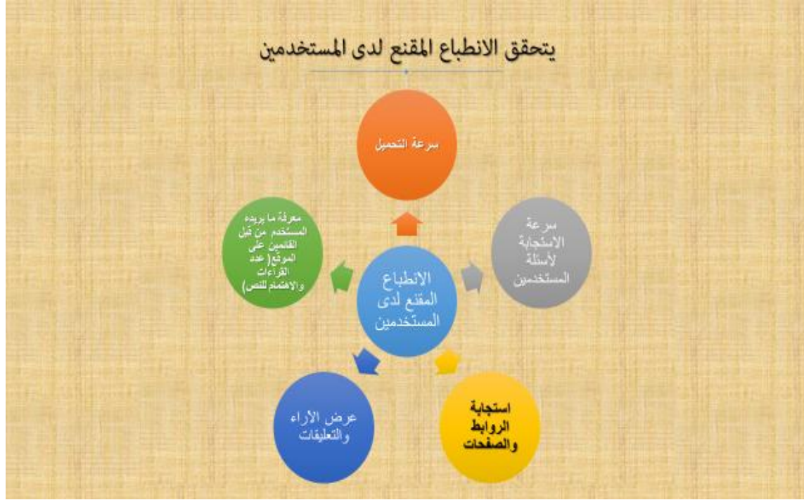
الشكل (2) من تصميم الباحثة يوضح كيفية تحقيق الانطباع الأول للمستخدم عن المواقع الالكترونية

وعناصر الاقناع البصري تتمثل في مفردات اللغة البصرية التي يستخدمها المصمم الكرافيكي وسميت بالعناصر نسبة الى إمكاناتها المرنة في اتخاذ أي هيئة مرنة وقابليتها للاندماج مع بعضها لتصبح شكلاً واحداً متناسقاً. والاقناع البصري هو علاقة ناجحة بين الشكل والوظيفة، أي ان الاقناع البصري يكشف عن ثقافة الذوق في الحس التصميمي والمضمون والثقافات الأخرى.