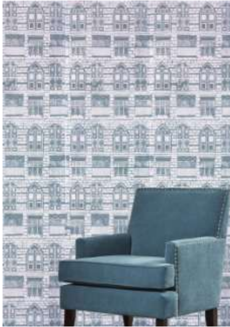
شكل يوضح الصورة النهائية للتصميم بعد عرضه على إحدى الجدران