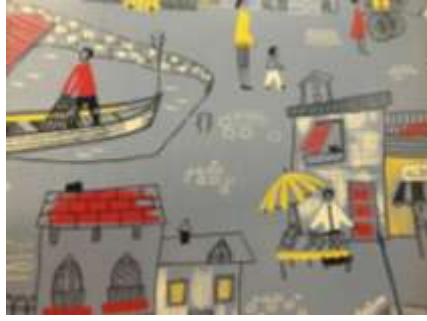
ورق جدران صنع عام 1950 م استوحى المصمم حياة القرية وأظهر مكوناتها من عمارة بالإضافة الى إظهار بعض المهن ووسائل المواصلات (1)