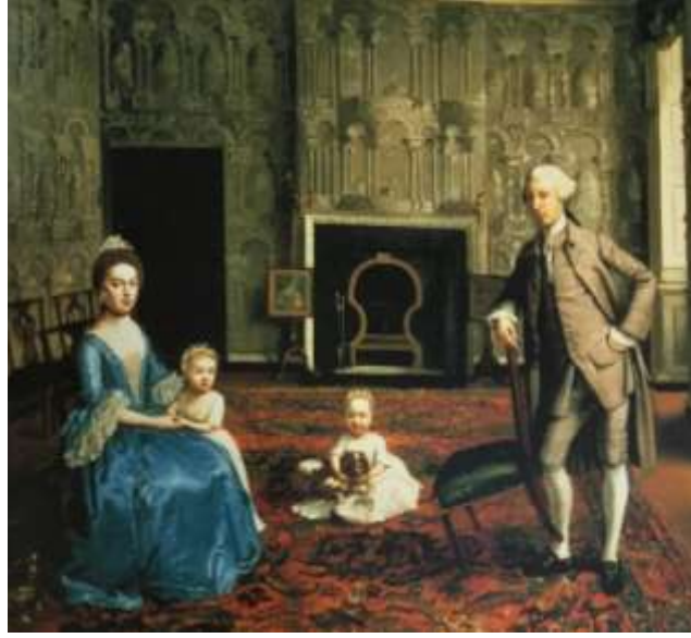
لوحة زيتية رسمت في عام 1760 م تظهر الخلفية ورقة جدران ذات طابع هندسي معماري (6)