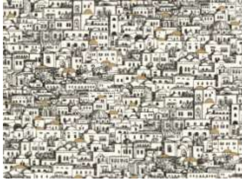
تصميم لورق جدران مستوحى من مباني منطقة البحر المتوسط عام 1940 م (3)