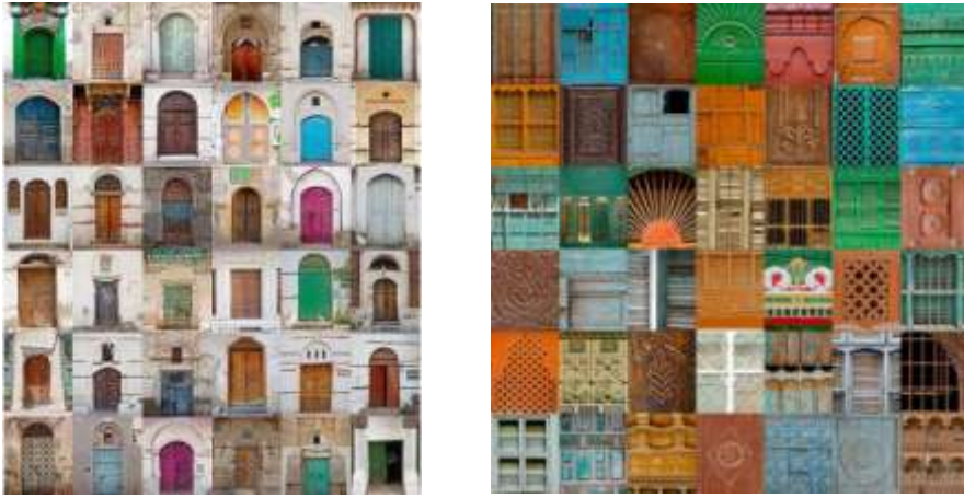
لوحتين للمصور البريطاني جيمس دومين تصوران بعض العناصر المعمارية لمنطقة الحجاز (12)