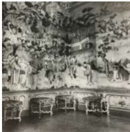
ورق جدران صنع في الصين واستخدم في إحدى القصور الأوروبية يرجع تاريخه إلى عام 1730 م (2)

بالنظر إلى تاريخ ورق الحائط نجد ارتباطه الوثيق باختراع الورق بشكل عام والذي يعود الفضل إلى الصينيين في ابتكاره، وتؤكد المصادر أنهم هم أول من قاموا بابتكار فكرة ورق الجدران ولقد انتشرت حول العالم بفضل الرحالة العرب، حيث كانت مصدراً للتبادل التجاري والمقايضة في التاريخ القديم. وقد استعان بها مصممي الديكور في تصميماتهم الداخلية ولذلك نجد النقوش الصينية (الزهور والطيور والحياة اليومية) قد غزت مساكن الأوروبيون وبشكل خاص في القصور والمساكن الفاخرة (1). وربما يعزو ذلك إلى الاستعمار الأوروبي لبعض مناطق العالم وإظهار جزء من معالم المناطق التابعة للإمبراطورية الأوروبية آنذاك كما يوضحها الشكل التالي