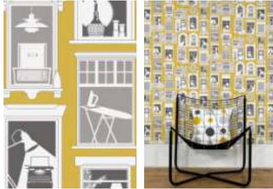
ورق جدران صمم حديثاً يظهر عنصر معماري (نوافذ) تظهر الحياة اليومية للمدينة وأهم مكوناتها (9)