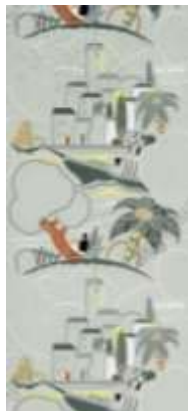
ورق جدران فرنسي الصنع صنع في عام 1950 م محفوظ في متحف التصميم والديكور بباريس ويلاحظ استخدام المباني المعمارية بالتبادل مع العناصر النباتية والطبيعية (8)