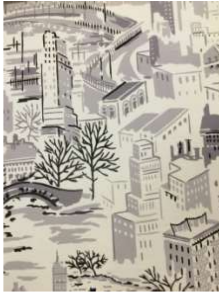
تصميم مستوحى من المباني الحديثة في أمريكا صمم عام 1950 م (8)