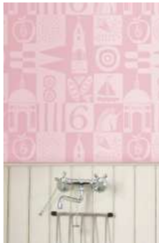
ورق جدران استخدم في دورة مياه يصور بعض المعالم الشهيرة ووسائل المواصلات والحياة اليومية لإحدى المدن الأوروبية بطريقة مبتكرة (10)