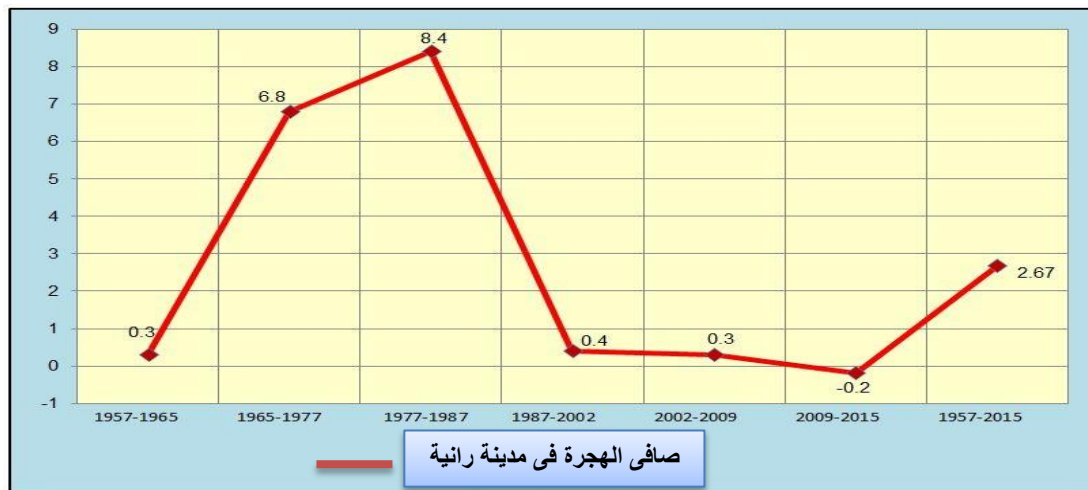
شكل رقم (10) صافى الهجرة فى مدينة رانية خلال عامى 2016-1957

مصدر: : من عمل الباحث بالاعتماد على بيانات الجدول (10)