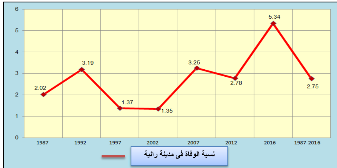
شكل رقم (2) نسبة الوفيات في مدينة رانية خلال عامي 1987-2016 من الالف

مصدر: : من عمل الباحث بالاعتماد على بيانات الجدول (2)