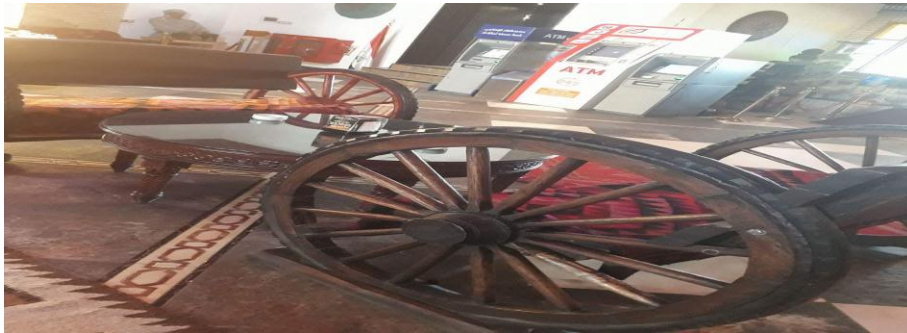
شكل رقم (5)

لذلك يعد ادراك العملية الذهنية التي تتحدد في موضوع بحثنا لاسيما في مجال الادراك المرئي للرمز و التي تؤثر في عقل المتلقي عبر توظيف الرمز التراثي مع معطيات الفضاء الداخلي المحيطة به لاسيما في مجال الادراك المرئي للرمز وعليه يتكون التصور العام للمدرك عند المتلقي والذي يركز على المعطيات الحسية كما في الشكل رقم5.