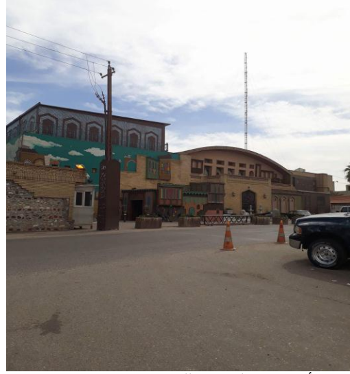
أ- يوضح الواجهة للمطعم