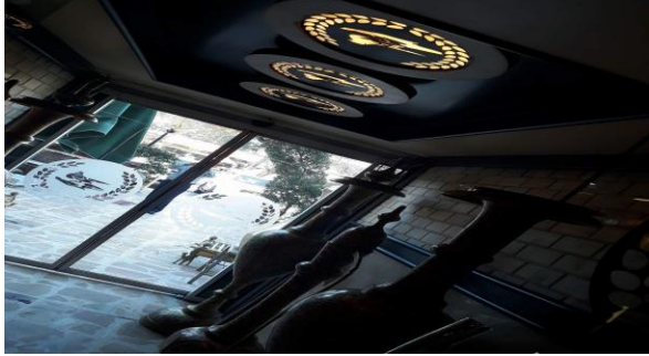
أ - شكل موجة الماء بنهر دجلة عيون بغداد

-السقف (Ceiling): للسقف دوراً بصرياً مهماً في تشكيل هيئة الفضاء الداخلي فهو يوفر الحماية الفيزيائية ويحدد بعده العمودي، ويصنف إلى نوعين: الأساس المتمثل بكونه جزء من النظام الإنشائي. والثانوي الذي يحدد توظيف الرمز التراثي وفق ضرورات التصميم الوظيفية ليؤدي توظيف الرمز التراثي وظيفية (ادائية وجمالية) تحدها الغاية التصميمية ، وبحسب طبيعته الإنشائية التي جعلته يتقبل معالجات تصميمية متنوعة عبر توظيف الرمز التراثي -يكون بطريقة تحاكي الاشكال الواقعية والتي من شأنها ان توجه أفتباه المتلقي نحوها...ومن هنا لا بد ان يتوخى المصمم الداخلي في عملية توظيف الوحدات التصميمية لتلك الرموز عبر بلورة مجموع خبراته المعرفية التصميمية وصولاً الى اضاء الديناميكية الفاعلة للرموز ضمن المجال الفضائي لمستويات السقف لكي تضي على هيئة الفضاء الداخلي للمطعم خصوصية مجتمعها فضلاً عن توظيفها خلفياً لمعلق به من مكمالات تصميمية كما هو الحال في المدخل الخاص بعيون بغداد.