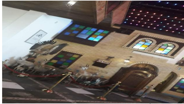
أ- مطعم عيون بغداد

شكل رقم 4 التزيينات المكملة للتصميم المستمدة من الموروث الشعبي