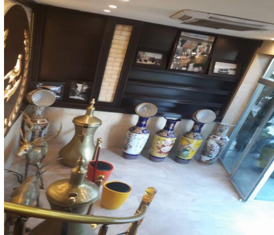
شكل (9) يوضح الاقتطاع الجزئي للجدار ( المدخل ) ليشكل خلفية للرموز التراثية الموظفة

أما على مستوى الجدار تم توظيف المصمم لألية اقتطاع جزئي منتظم للشكل المستطيل بتوظيف المرمر البني الفاتح المحدد بمادة الخشب البني الغامق والذي يعلوه مادة انهاء حديثة تعكس الطابوق العراقي (كرمز تراثي) ليشكل الجدار خلفية ناجحة للدلال والمشربيات المزينة بالزخرفة النباتية ذات اللون الاخضر والبرتقالي المنسجمة مع مادة الدلال والمشربيات ( النحاس ) ولتشكل موجه للمسار الحركي باتجاه فضاء الاستقبال بينما جاء فضاء الادارة بمكتب خشبي حمل اسم المطعم وصاحبيه وضع عليه انية وصندوق مستمدة من الموروث العراقي ليشكل الجدار المقابل لفضاء موظف الاستقبال ذات خلفية لربابة عراقية وهي تحتضن دلال ومشربيات من الموروث العراقي تعلوها ساعة بتصميم خشبي على هيئة جامع بمأذنتين خشبية لتحقيق حركة مغايرة بين المشهدين بتوظيف الرمز التراثي المتباين مادياً ولمسياً عن الشكل الأساس للجدار من دون ابتعاده عن الشكل الأساس للأنموذج كما في الشكل (9) الفتحات: "أخذت الابواب والشبابيك في الانموذج الثاني الجزء الاكبر من تصميم الواجهة محققة تواصل وانفتاح مع الطارمة الخارجية التي وظفت بتوظيف فعالاً للرمز التراثي كجلسة اشبه بالجلسة التقليدية المفضلة لدى العراقيين "جلسة الحوش، أو الطارمة عند وقت العصر او في المساء" كما في الشكل (8-أ) كما تقدم اطلالة على البيئة الخارجية من الطا بقبين العلويين فضلاً عن وظيفتها الرئيسية (الدخول والخروج مع تبادل تيارات الهواء بين الداخل والخارج ومنفذ الإضاءة الطبيعية في المطعم تشكلت نقطة جذب للمتلقين فجاءت على هيئة جداراً شفافاً بإكماله (فتريته) تخترقه الأبواب التي تقدم مدخلاً مباشراً للفضاء، فضلاً عن أسهامها في توجيه الحركة. الإدراك عبر الرمز التراثي :