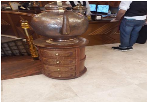
ب- مطعم كباب زرزور

التقنيات والأساليب التصميمية الحديثة وبطريقه مدروسه لتساعد في تحقيق جذب فضلا عن الوظيفة الجماليه والتعبيرية . د-- أنظمة التحكم البيئي و الستائر الداخلية وأجهزة العرض الحديثة وتقنية الإضاءة و أنظمة توصيل الماء والتصريف الصحي، فضلاً عن توفير مطافئ الحريق وأجهزة الانذار المبكر للحريق وكاميرات المراقبة والتي تعمل بشكل متواصل على مدار اليوم. - سادساً :التزيينية (الاكسسوارات ): والتي عادة ما يكون لتوظيف الرمز التراثي بجماليته الحيوية وخصوصيته التراثية عبرها من دون أن يكون لها غرض نفعي، كالتزيينات المكملة للتصميم من (الأحجار والايقونات والمرابيا، التماثيل) التي تعكس الموروثا لشعبي كما في الشكل 4