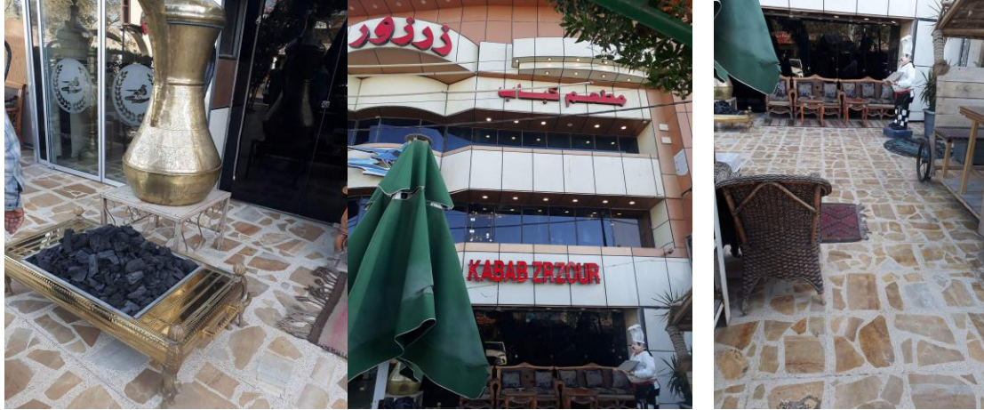
أ- جلسة الطارمة الخارجية ب- الواجهة ج- توظيف الرمز التراثى فى الطارمة شكل ( 8 ) يوضح توظيف الرموز التراثية فى واقع حال الانموذج الثانى

. الوصف العام: يقع النموذج على شارع رئيس وتجارى في المنصور ، فيما أُنخذ المحتوى الوسطى ضمن المبنى الحائى كما فى الشكل (8)، ذات نمط شكلى مستطيل بحيث قدم استمرارية بصرية وحيزية باتجاه محوره الطولى فضلاً عن تقديم المدخل الوسطى مساراً حركياً خطياً سهل أداء فعاليات متنوعة وقد أسس النموذج كمطعم سياحى فى الجهة المقابلة لشروق الشمس