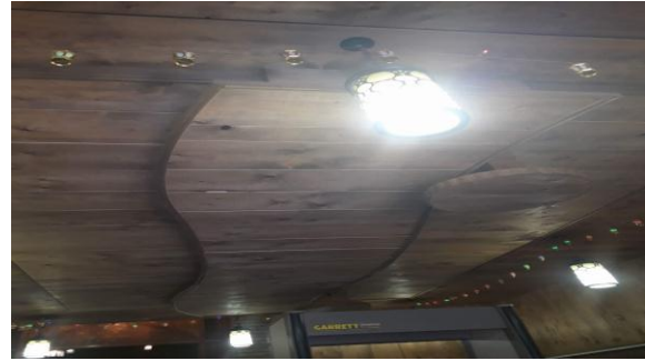
ب- تحمل شكل طائر الزرزور