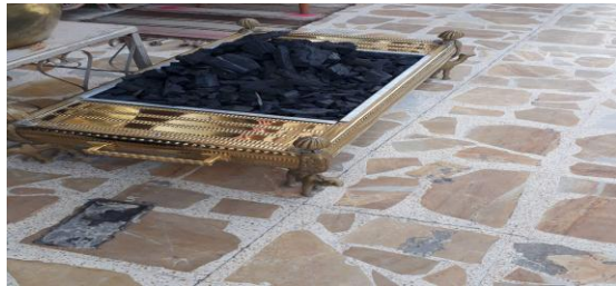
أ- ارضية مدخل مطعم كباب زرزور

شكل 3 رقم 1 توظيف الارضية كأطار لما يوضع عليها