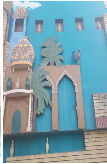
ب- يوضح واجهة المدخل