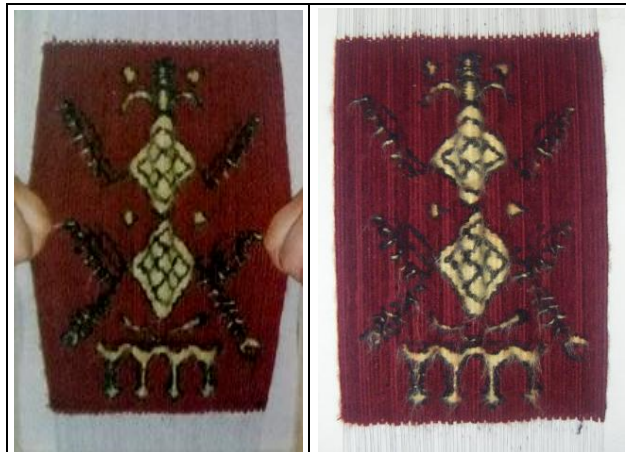
فعل الجذب والتّمطّط، 23/26 صم

ارتأينا في خضمّ منهج البحث في تشكّلات خيوط السّدادة، توظيف مادّة "الأسستيك" لتميّزها بخصوصيّات مميّزة ومُتقرّدة. وقد عكس فعل النّسج عليها بعد توزيعها في الفضاء النّسيجي، ثراء تشكّليّا فعّله مفهوم التّمطّط والتمدّد الّذي تغيّر في واقعه حجم المنسوجة. هو تشكّل استدعى حضور الذات لتفعيله، في حواريّة ظريفة بين الأنا والعمل النّسيجي عبر فعل الجذب فرضتها المادّة المُتمطّطة، لثُغادر المنسوجة حيّزها المكاني الأصلي وتحتّ رحالها في حيّز مكاني افتراضي وهميّ وظرفي ينتهي بانتهاء الفعل. هي حركيّة كامنة في طبيعة المادّة الثّابتة، عمّقت في باطنها فعل التّعديّ على النّسق الجامد رغم ظاهرها السّاكن.