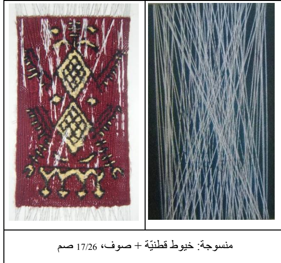
منسوجة: خيوط قطنية + صوف، 17/26 صم

في نفس السياق التشكيلي الذي يقوم على بعثرة نظام السدى، ارتأينا في بحث آخر ينخرط في بوتقة هذا المسار، الحفاظ على النسق التقليدي في علاقة الأفقي بالعمودي، ونقصد خيوط اللحمية وخيوط السداة، في مستوى معين من بناء المنسوجة. ومن ثمة حُررت خيوط السداة من ارتباطها الوثيق بالمسامير المثبتة فيها بنظام ودقة، لتتقسم إلى مجموعتين مختلفتين وُرعت كل واحدة منها في فضاء الإطار بطريقة متضادة تبادلت فيها مواقعها الاعتيادية. هو قلب للنظام قد تمثل في منظومة تشكيلية قوامها البناء والهدم وإعادة البناء، شوش التركيبية وجزأها وفرض عليها قوانين تقنية جديدة فعلها مفهوم التراكب، ذلك الشيء الذي يضم الشيء الآخر ويحجبه في مستويات حسب تفاعلات الدوات الباحثة فيه. فتتداخل الأشكال وتختفي بعضها من عناصرها في إطار جدلية الحجب والكشف، وفي كنف بروز بعض الطيات والانثناءات التي عمقت ذلك. تمظهرات تشكيلية تحولت عبرها البنية النسيجية والتركيبية التي فقدت فيها "العلامة التقليدية" جل خصوصياتها، خاصة في ما يتعلق بحضورها المركزي في التركيبية وتوازيها وتناظرها وتعبيريتها التي تلاشت معالمها في غمار شكل هذا التدخل التقني والفعل المتسلط المقوض للنظام، الذي أربك فانتك فبذل بنية المنسوجة التقليدية وتناسقها المألوف، ليتغير على إثرها الشكل والمضمون وتخلق في بوتقتها معاني تعبيرية ودلالات جديدة.