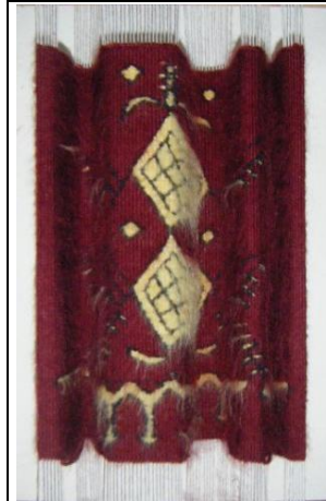
منسوجة: خيوط قطنية+صوف، صم 17/26