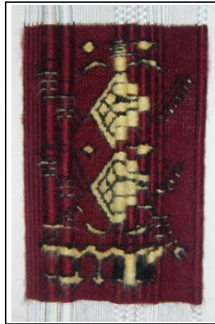
منسوجة: حبال، خيوط قطنية+صوف، 17/26 صم

تعتبر المادّة أساس الفعل التشكيلي، إذ "لا حياة بدون مادّة" 15 فلم يكن توظيف المواد والخامات كبديل لخيوط السداة، إلا بحثا عن سياقات جديدة يتحوّل معها الواقع النسيجي التقليدي. وفي هذا المستوى، كان تعاملنا مع المادّة تعاملًا انتقائيًا اختزلت فيه المميّزات العامّة للمواد، في محاولة لتجاوز الخصائص الفيزيائية التقليدية لخيوط السداة. فقد عوّضت "الحبال" الخيوط المعتادة، لتتوزّع في الفضاء النسيجي في سمك متفاوت. حوارية بين الأحجام حادت عن التماهي لتؤسس كلاً مؤتلفاً ومُنسجماً في إيقاعية احتفالية فعلها تراصّ اللحمية. ومن ثمة، أثرت طبيعة المادّة على أشكال وموتيفات العلامة التقليدية التي انساقت لخصائصها التعبيرية. فبين الحضور والغياب وبين التضخّم والتقرّيم الذي عمّق مفهوم الانزلاق، يتأسس واقع جديد للتركيبية التي تخرج فيها من جمودها الكلي فتخلق واقعا مرئياً مختلفاً فعله اختلاف المستويات.